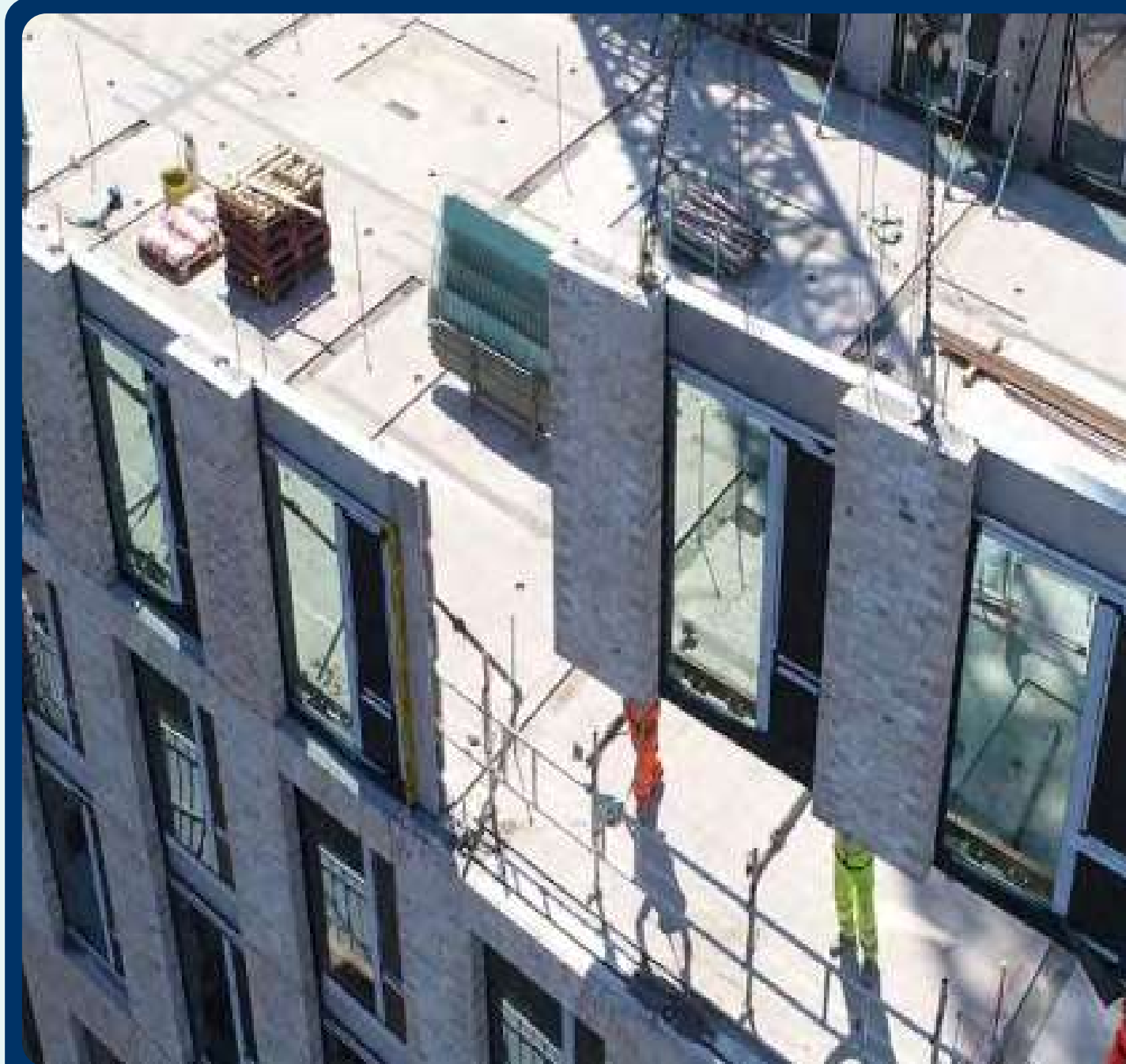
Nuove Costruzioni industrializzate