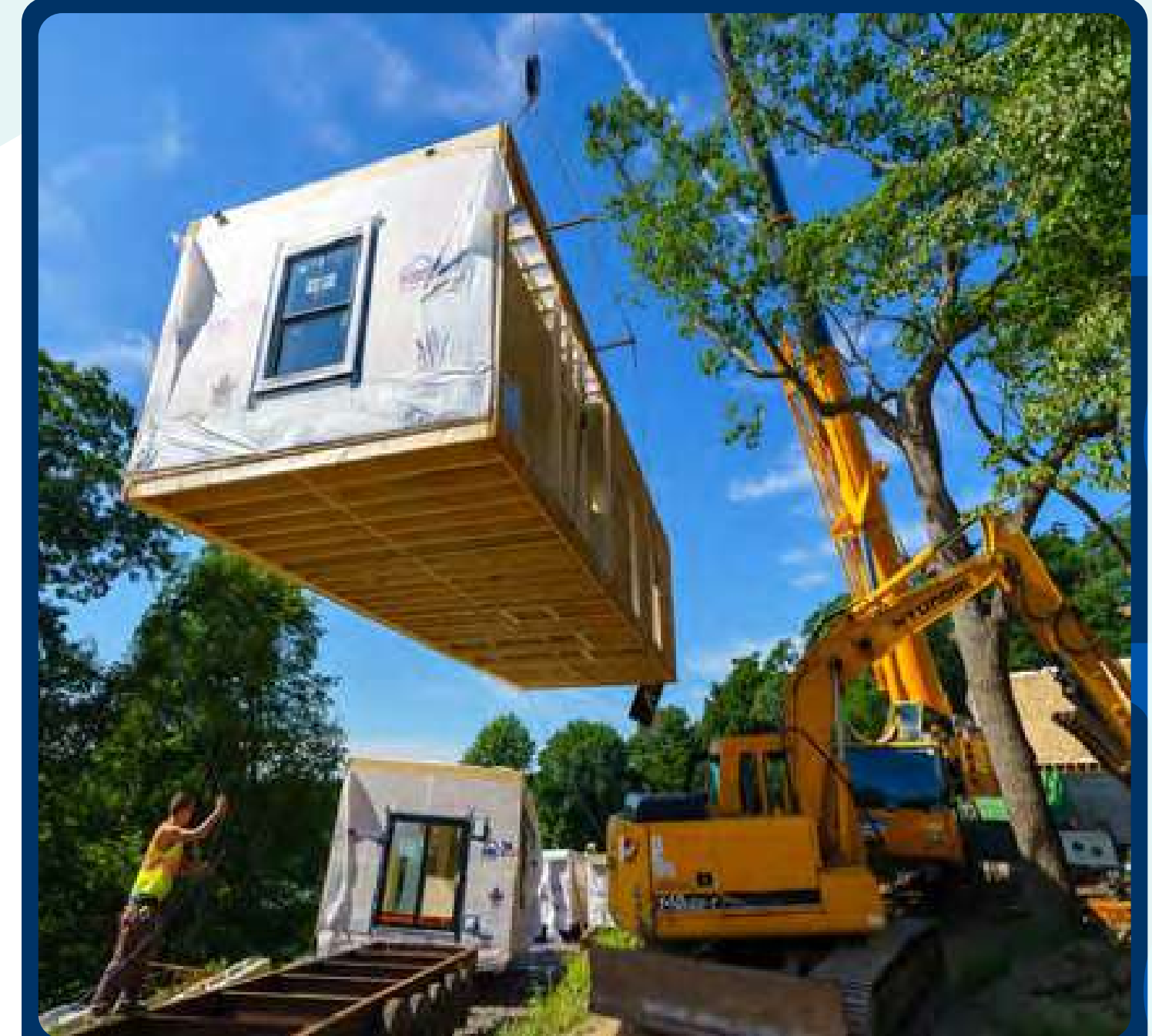
Edilizia Temporanea modulare